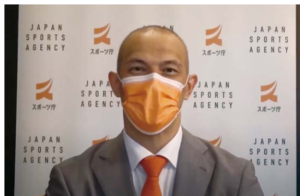
スポーツ庁室伏長官からのビデオメッセージ