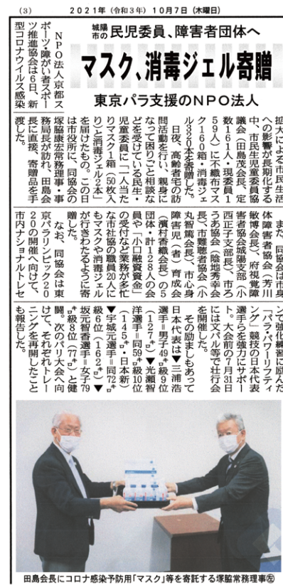
▲ 2021年10月7日 洛タイ新報

令和3年12月21日に城陽市立青谷小学校、令和4年1月18日には古川小学校のいずれも6年生2クラスを対象にポッチャ授業を城陽市ポッチャ協会が行ったが、当協会からも協力支援を行った。