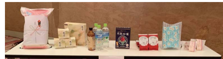
お米や梅製品 などの 寄贈品

大和ハウス工業(株)、JA 京都やましろ、サントリープロダクツ(株)、星和電機(株)、 (社福)南山城学園、(社福)みねやま福祉会、(社福)松寿苑、(社福)京都基督教福祉会、 (社福)松花苑、(社福)秀孝会、(株)おうすの里、木村農園、京都城陽ロータリークラブ、 (株)杜若園芸、京都焼肉南大門(宇治槇島店)、NPO法人で・らいと、医療法人啓信会 京都きづ川病院