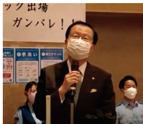
奥田城陽市長の挨拶