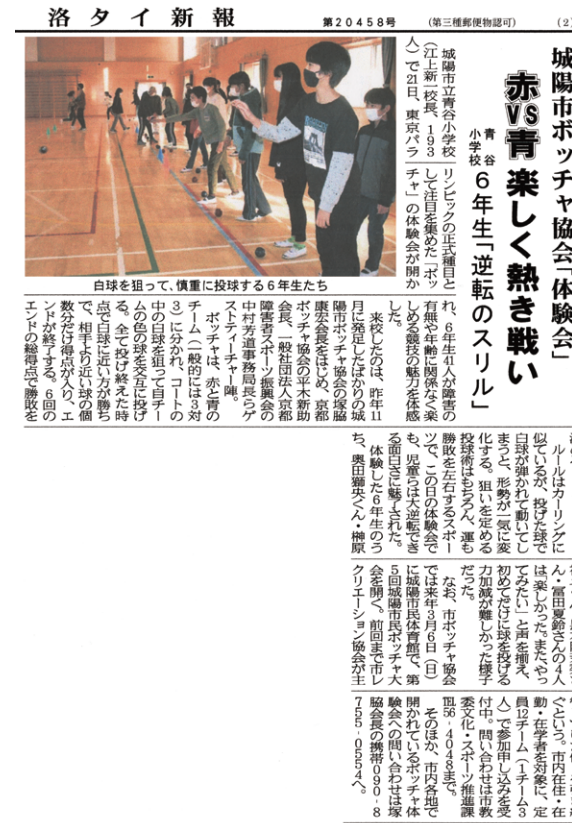
▲ 2021年12月22日 洛タイ新報