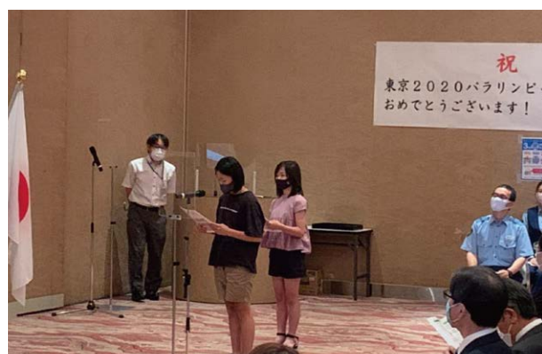
青谷小学校児童の応援メッセージ読み上げ