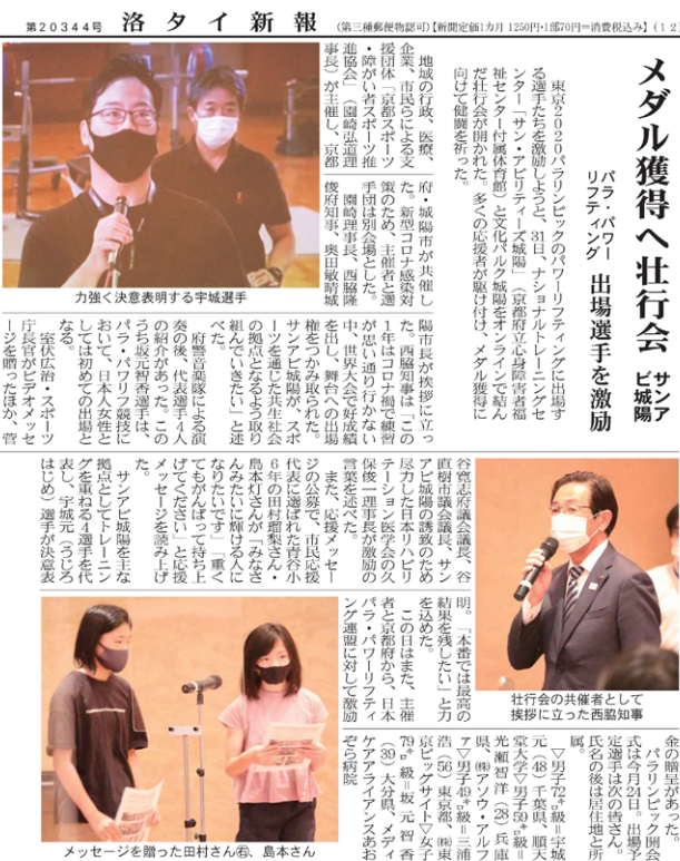
▲ 2021年8月1日 洛タイ新報