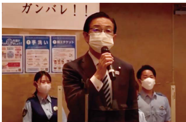
西脇京都府知事の挨拶