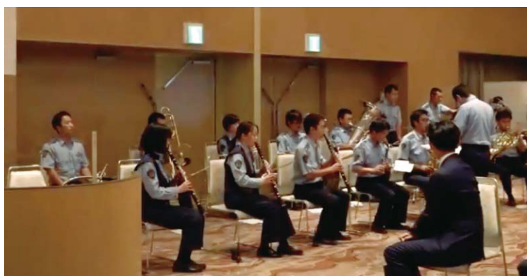
府警音楽隊の演奏