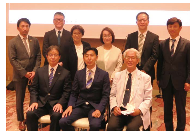
終了後の記念写真